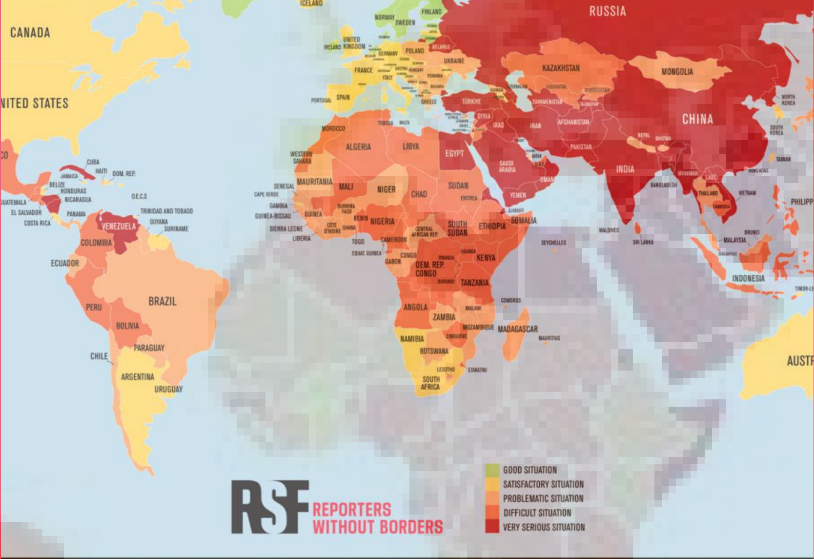
FREEDOM OF THE PRESS WORLDWIDE 2023

CLASIFICACIÓN MUNDIAL DE LA LIBERTAD DE PRENSA 2023