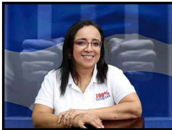
Lucía Pineda: Premio Internacional Coraje en Periodismo (IWMF, 2019).